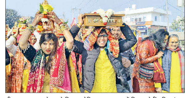
श्रीमद्भागवत कथा के पहले दिन आयोजित कलश यात्रा में हिस्सा लेती महिलाएं।