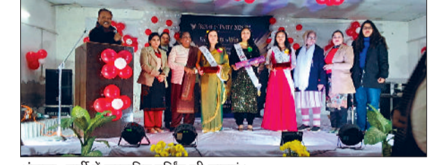
अंबाला। पार्टी में सम्मानित नर्सिंग की छात्राएं।