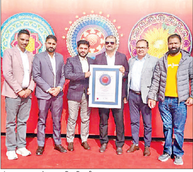
अंबाला। पुरस्कार के साथ कृषि अधिकारी।

खेतों में आग की घटनाओं में अभूतपूर्व कमी लाने तथा पर्यावरण संरक्षण की दिशा में प्रभावी रणनीति अपनाने के लिए मिला अवॉर्ड