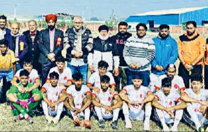
पानीपत। विजेता टीम के साथ अतिथिगण व आयोजक।