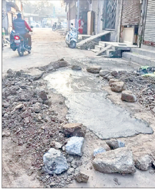
अंबाला। खुले सीवरेज की रिपेयर का दृश्य।