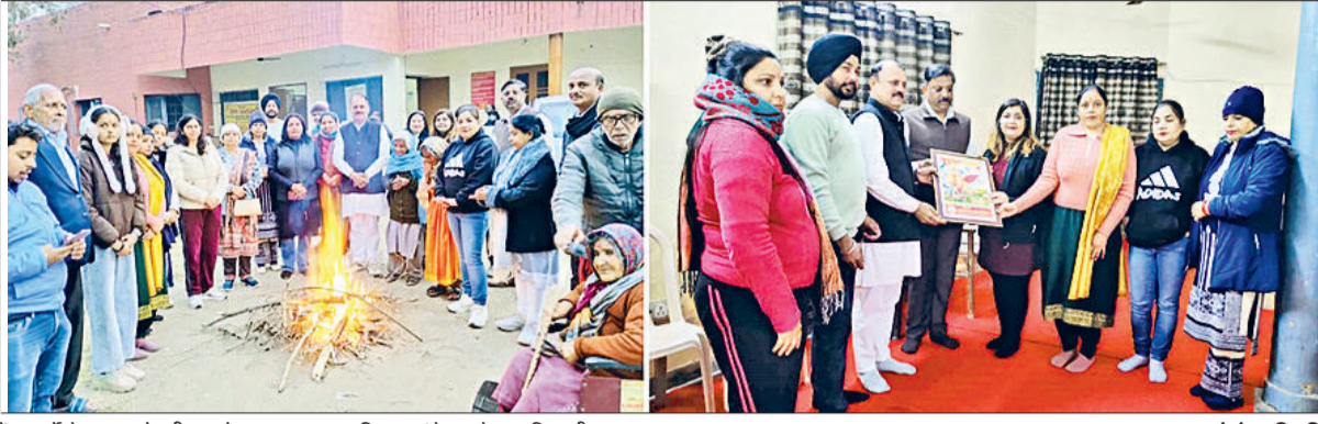
करनाल। वृद्धाश्रम में बुजुर्गों के साथ लोहड़ी मनाते मानवता जन शक्ति फाउंडेशन के पदाधिकारी।