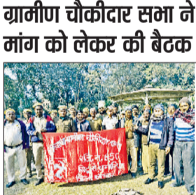
करनाल। कर्ण पार्क में आयोजित ग्रामीण चौकीदार सभा की बैठक में उपस्थित पदाधिकारी।

की जानकारी रेडियो व अन्य माध्यमों से लेते रहें। उन्होंने कहा कि सर्दी से बचाव के लिए परतदार कपड़े पहनें, सिर व मुंह ढककर रखें, गर्म तरल पदार्थ का सेवन करें और शराब से परहेज करें।