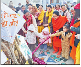
अंबाला। लोहड़ी मनाती महिला श्रद्धालु।