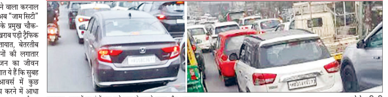
करनाल। सड़कों पर घंटों तक लगे जाम से जूझते वाहन और आमजन।

□ शहर में फिलहाल 6000 से अधिक ई-रिक्शा संचालित हो रहे हैं, जो अत्यवस्थित ढंग से सड़कों पर खड़े होकर और बीच रास्ते रुकने के कारण जाम का बड़ा कारण बनते हैं। □ ई-रिक्शा चालकों के लिए अलग-अलग निर्धारित स्टैंड बनाए जाना आवश्यक है, ताकि सड़क पर अनियंत्रित पार्किंग रोकी जा सके। □ शहर में भारी वाहनों की छंटी सुबह 8 बजे से रात 8 बजे तक पूरी तरह बंद की जानी चाहिए, जिससे दिन के समय यातायात का दबाव कम हो। □ किसी भी सड़क निर्माण, सीवर, जलापूर्ति या अन्य विकास कार्य को शुरू करने से पहले रूट डायवर्जन की जानकारी का जैसे-जैसे आमजन तक अनिवार्य रूप से पहुंचाया जाए। □ वर्तमान में डायवर्जन की स्पष्ट सूचना न मिलने से लोग जिस रास्ते से सुविधा मिलती है, वहीं से निकल जाते हैं, जिससे अत्यवस्था और जाम की स्थिति बनती है। □ ट्रैफिक डायवर्जन को एक तय सिस्टम और पूर्व नियोजित योजना के तहत लागू करना जरूरी है। □ ई-रिक्शा, भारी वाहन और डायवर्जन व्यवस्था को लेकर एक स्थायी और समग्र यातायात नीति लागू किए बिना जाम से स्थायी राहत संभव नहीं है।