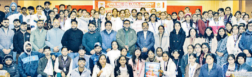
पानीपत। स्वदेशी विषयक संगोष्ठी में शामिल होते विद्यार्थी।